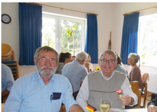
Danske og tyske deltagere mødes til reception