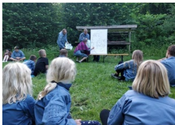
Spejdere på skattejagt

De to spejderorganisationer samarbejder fortsat og håber nu på at kunne gennemføre deres oprindelige plan i sommeren 2022.