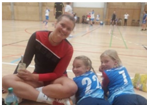
Håndboldspillere fra HSG Holsteinische Schweiz