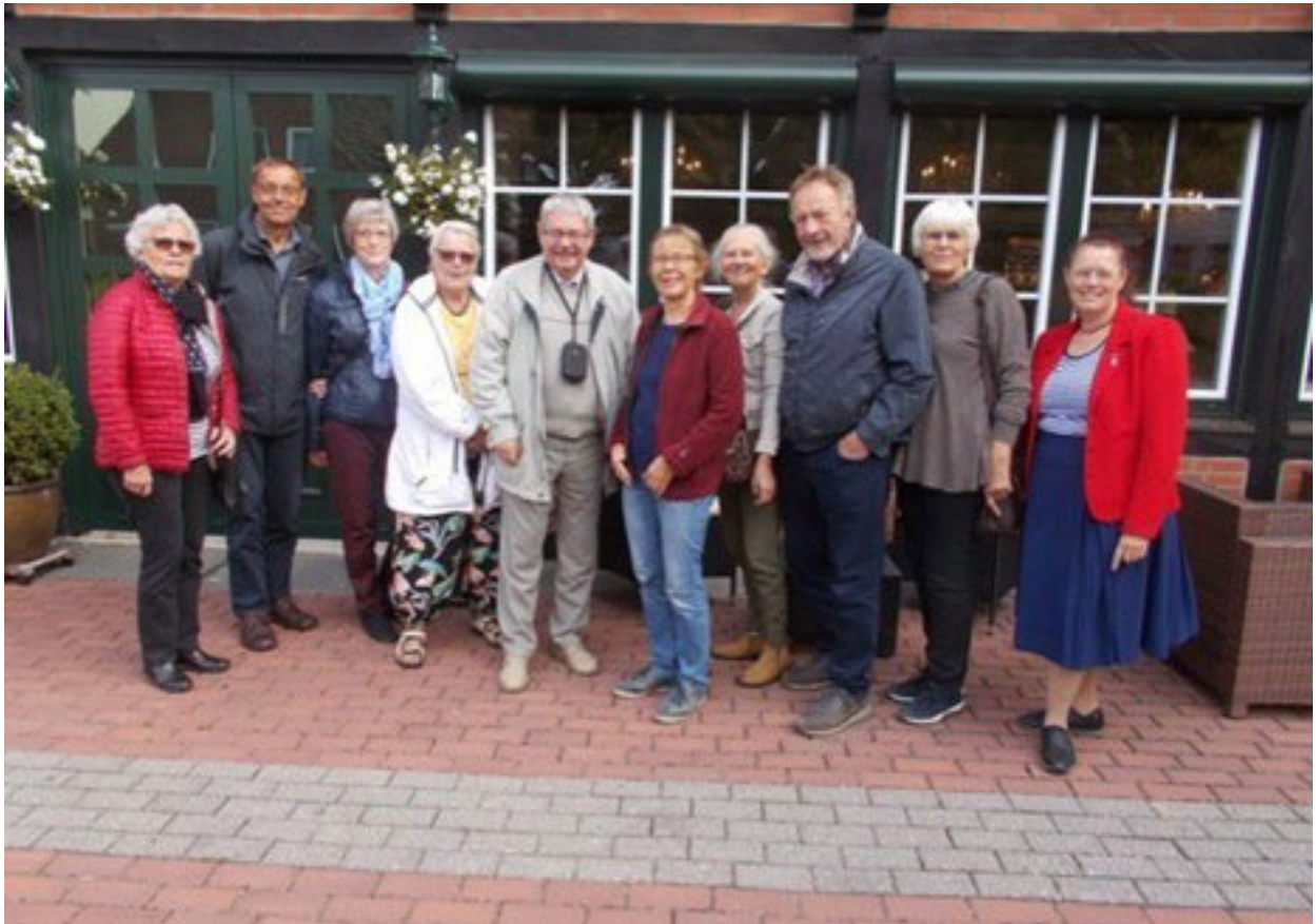
Gruppenbillede af de danske deltagere