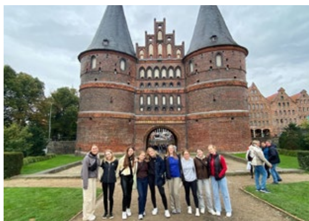
Deltagere ved Holstentor byporten i Lübeck

Den 3. december 2019 rejste 19 ottendeklasseelever fra Nymarksskolen i Svendborg så til Lübeck med deres tysklærer og blev indkvarteret på et vandrehjem. Næste morgen mødtes de to klasser og lærte hinanden at kende gennem små aktiviteter, der skulle bryde isen og udveksle ideer i gruppearbejde om emner som skole, juletraditioner, idrætsaktiviteter og ungdomskultur. Det gik ud på, at eleverne også tænkte over deres egen kultur og kunne beskrive og forklare den, så de kunne genkende og forstå ligheder og forskelle. Isen blev hurtigt brudt, og der var en livlig udveksling på tysk og dansk, selvom der fra tid til anden blev trukket engelske glosser frem. Deltagerne præsenterede og diskuterede efterfølgende deres resultater. Derefter udforskede de Lübeck i blandede grupper. Eleverne fra Lübeck havde tidligere beskæftiget sig med deres egen by og fungerede nu som rejseledere for deres gæster. Dagen efter bød på et besøg hos Niederegger Marcipan Muse-