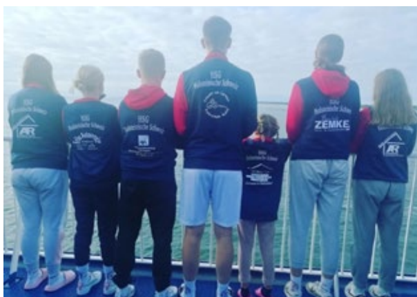
Kort pause på færgen til Danmark

For begge parter var det nye samarbejde en kæmpe gevinst, som i fremtiden fortsat vil videreudvikle spillere og træneres sportslige kompetencer samt opbygge et interkulturelt forhold mellem håndboldklubberne. Udover spillerne og deres trænere er de to klubbers bestyrelser også involveret i projektet. Deres mål er at bruge projektet til at koble idræts- og foreningslivet i grænseregionen mere og mere sammen og at lære af hinanden.