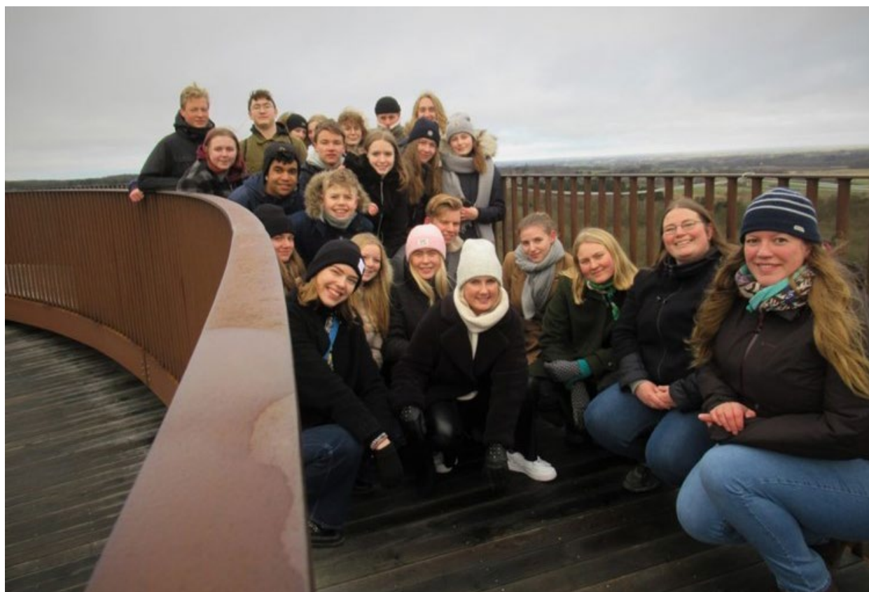
Tyske elever på Sjællands højeste punkt

Thomas-Mann-Schule Lübeck & Næstved Gymnasium 12.11.2019 – 15.11.2019 – Lübeck & 27.01.2020 – 30.01.2020 – Næstved – 27 deltagere