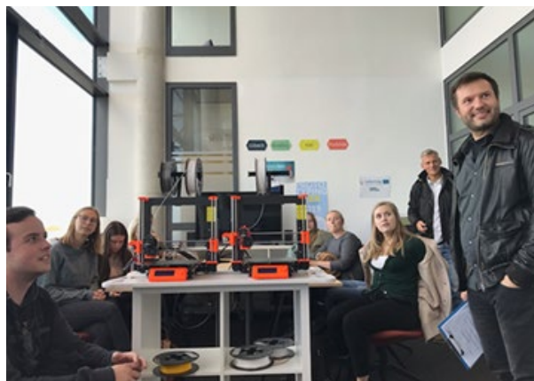
Indblik i praksis

Projektet startede allerede hjemmefra, hvor deltagerne forberedte præsentationer om deres by og skole, og koordinatorene fra begge skoler forberedte en undersøgelse af dansk-tysk virksomhedskultur baseret på SMiK-projektets forskning i stereotyper. Da deltagerne mødte hinanden, besøgte de ikke kun den pågældende skole, men også lokale virksomheder og foreninger. Her hørte de oplæg om regionen, diskuterede betydningen af Femern Bælt-projektet og gennemførte interviews, der belyste den dansk-tyske virksomhedskultur. Dette gjorde dem i stand til bedre at kunne reflektere over resultaterne af deres undersøgelse og inkorporere disse i et rollespil i blandede grupper om international management. Møderne med gæsterne var særligt spændende for eleverne, idet de fik viden og indblik i ting, som de næppe ville kunne lære i skolen. Og selvfølgelig ønskede hver gruppe at vinde sejrspokalen for det bedste rollespil. Måske har de herigennem